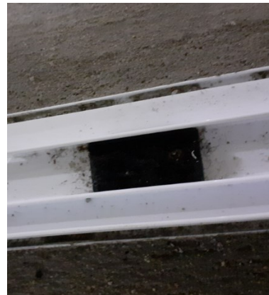
Foto 4 – Segmento de escova presente à meia largura das travessas do marco.